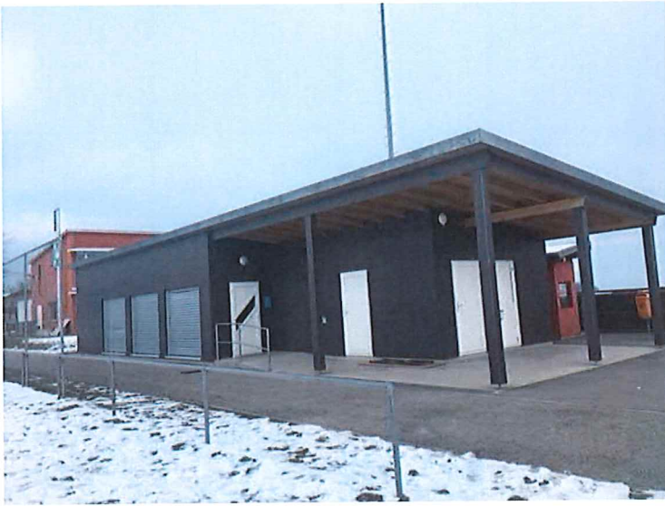
Buvette de Murist